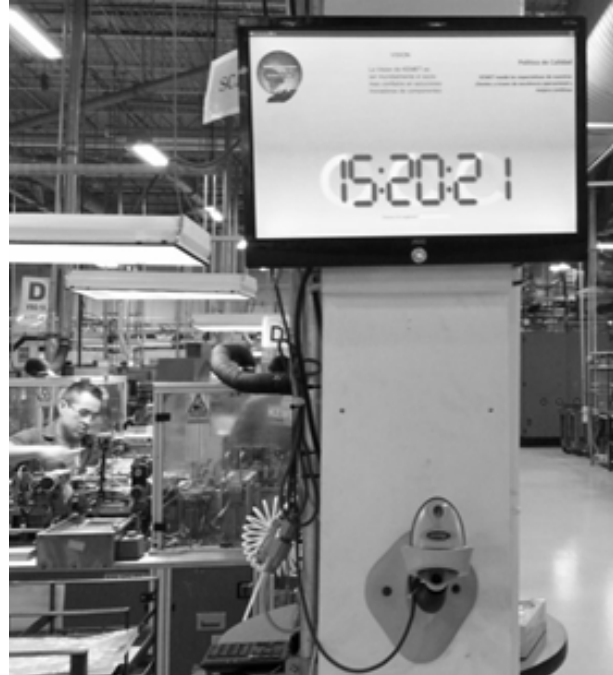
Fotografía 2. Reloj Computacional tipo “tiempo log”, implementado en Kemet Ciudad Victoria